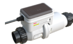
INTELLICHLOR PLUS60 (2.0)