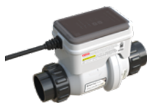
INTELLICHLOR PLUS30 (1.10)